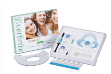
Everbrite® 威而白雙氧牙齒美白劑