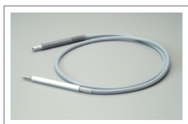
把手線 (手指開關環)